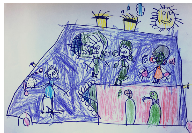
Bertík 3 roky „Policisté vezou zločince“.

Věnujme pozornost dětem, u kterých se spojuje nadání s handicapem různého druhu, stupně a intenzity. U této specifické skupiny nadaných dětí lze nadání obtížně identifikovat. Tyto děti bychom měli vnímat jako mimořádně zranitelné. Při souběhu nadání a handicapu se u dětí soustředíme zároveň na posilování jejich silných stránek i na vyrovnávání jejich deficitu.