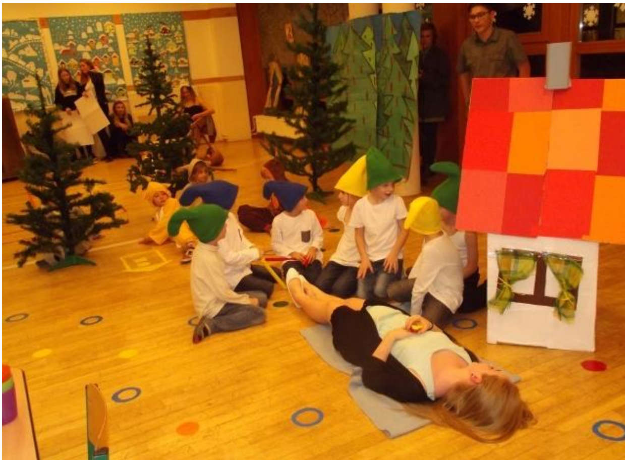
Den otevřených dveří školy