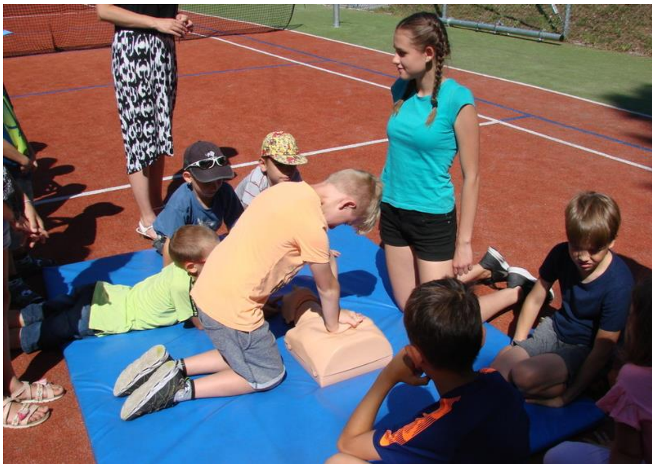
Den prevence a 1. pomoci

Den prevence a první pomoci : 25. 6. 2019 - byl realizován formou peer to peer, kdy na jednotlivých stanovištích ukázky předváděli žáci 8. třídy svým spolužákům a vyučující zde byli pouze v roli dohlížejících.