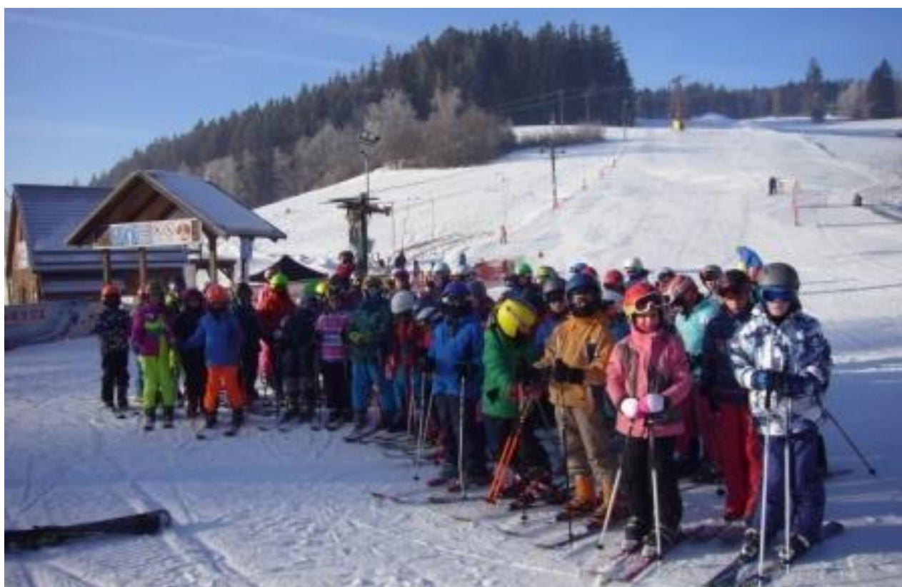
Lyžařský kurz v Hodoníně u Kunštátu