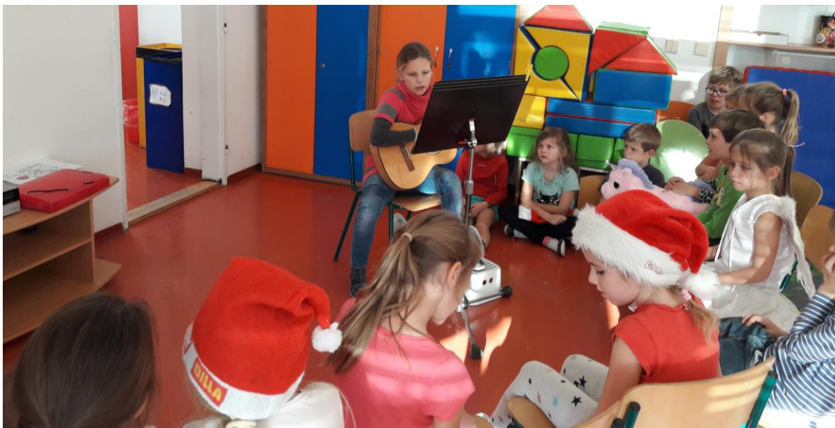
Vánoční koncert ZUŠ ve ŠD

Vánoční koncert ve ŠD - děti ze ZUŠ Adamov / p. uč. Audy/ - 10. 12. 2018