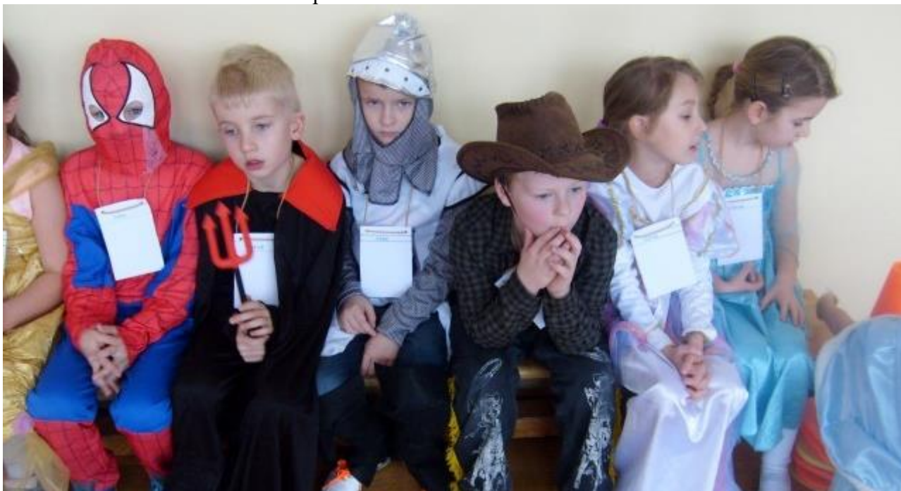
Karneval žáků 1. stupně ZŠ

25. 1. 2019 – Karneval žáků 1. stupně ZŠ ve školní tělocvičně