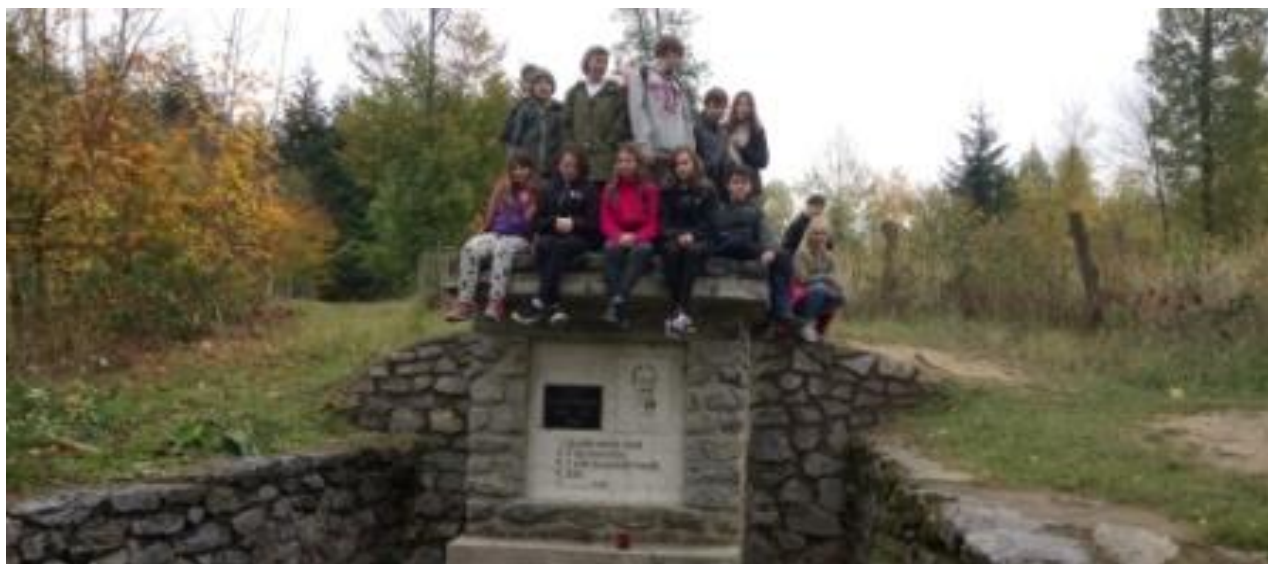
Výročí 100 let od vzniku republiky

100. výročí vzniku republiky: 26. 10. 2018 – slavnostní shromáždění u lípy vysazené k příležitosti výročí, dále se jednotlivé třídy vypravili do okolí Křtin k různým pomníčkům, které zde v uplynulých letech vznikly jako připomínka nejrůznějších dějinných událostí. Celé dopoledne bylo završeno návštěvou místní cukrárny, ve které byla nainstalována výstava týkající se 100. výročí vzniku republiky. Na této výstavě se svými výtvarnými pracemi podíleli také žáci naší školy. Žáci 8. a 9. ročníku měli místo vycházky projektový den „Umím nás bránit“, který pro ně uspořádal spolek PRESAFE z. s, za podpory Ministerstva obrany.