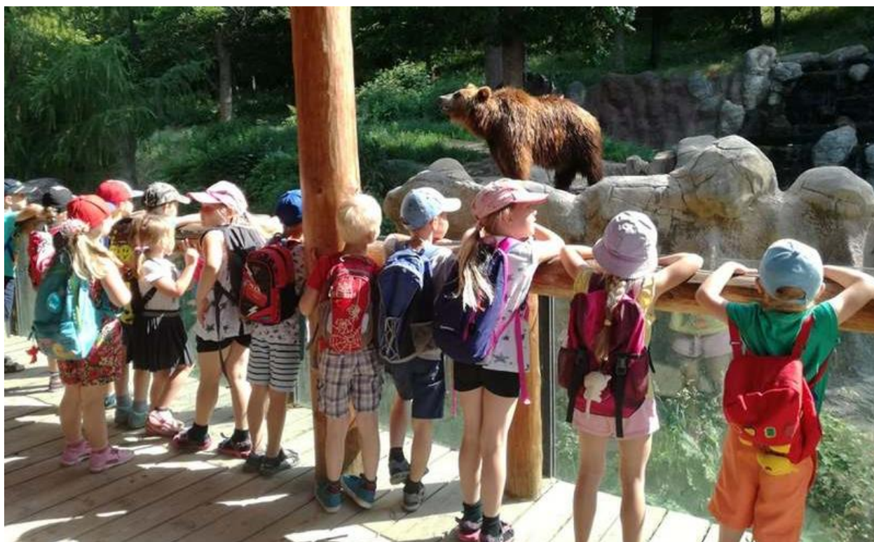
Výlet do ZOO