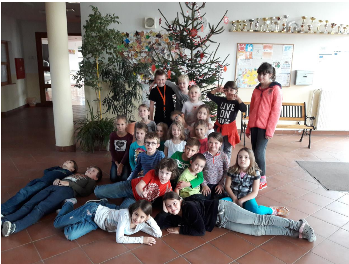
Zdobení vánočního stroměčku