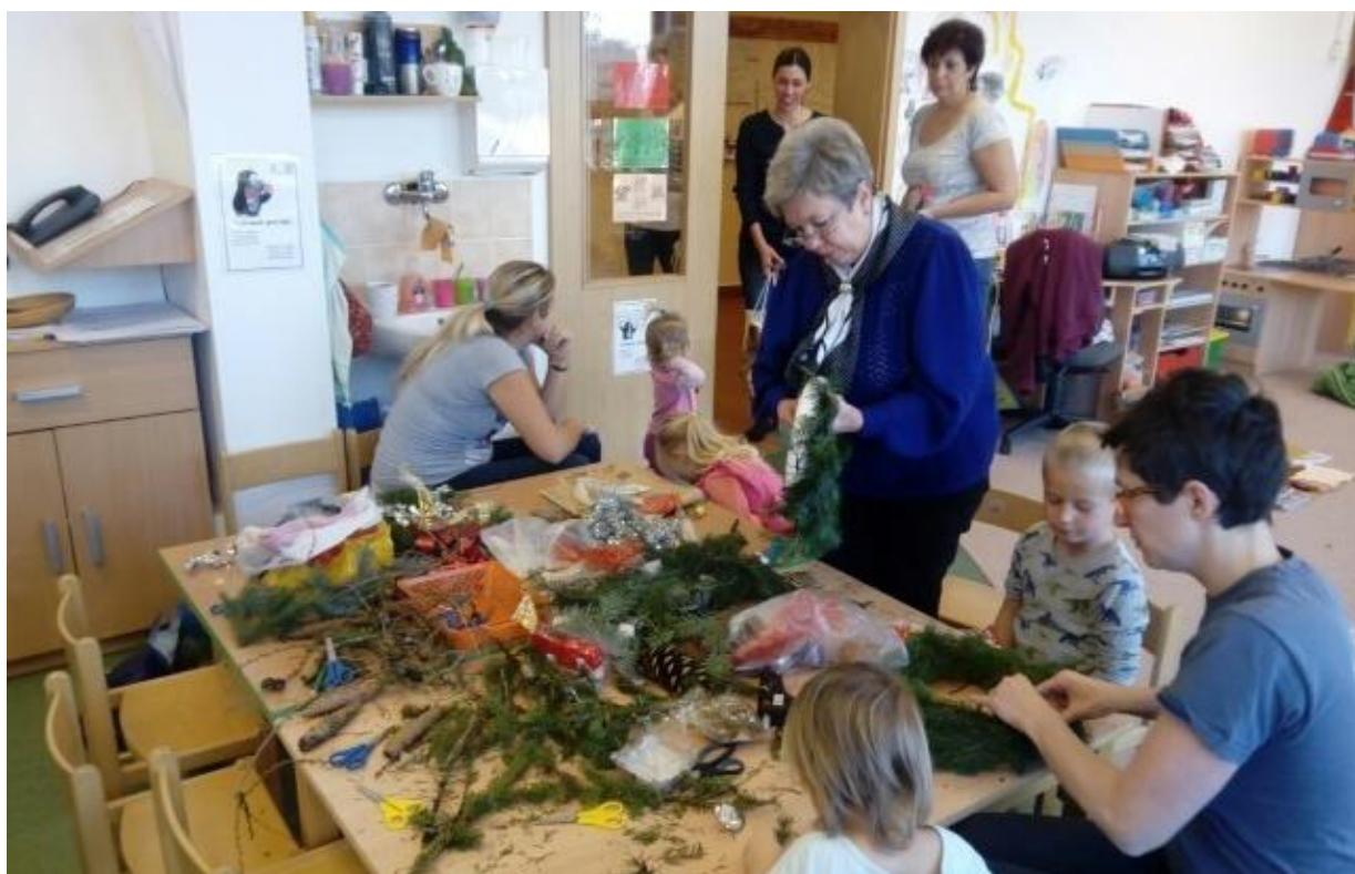
Vánoční tvoření s rodiči