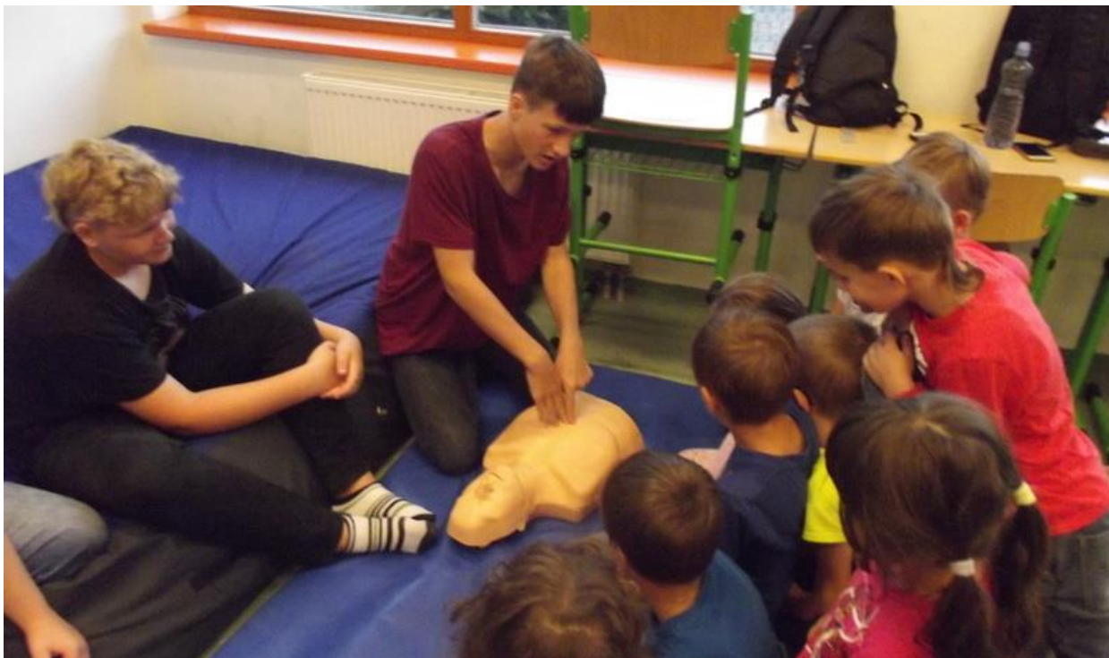
Den prevence a 1. pomoci