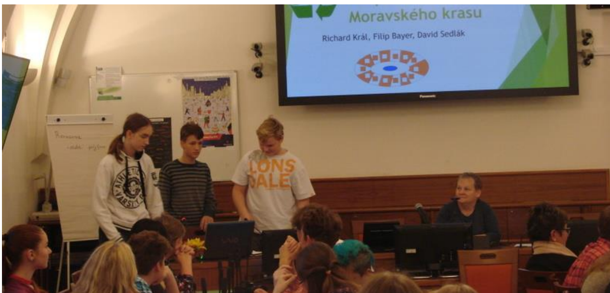
ŽEK v Praze

Žákovská ekologická konference v Praze 13. 11. 2017 – konference se konala pod záštitou UNESCO a organizátor byl KEV, místo konání MŠMT Praha. Naši školu reprezentovali tři žáci 8. třídy s prací „Vodní a odpadové hospodářství obcí Moravského krasu“.