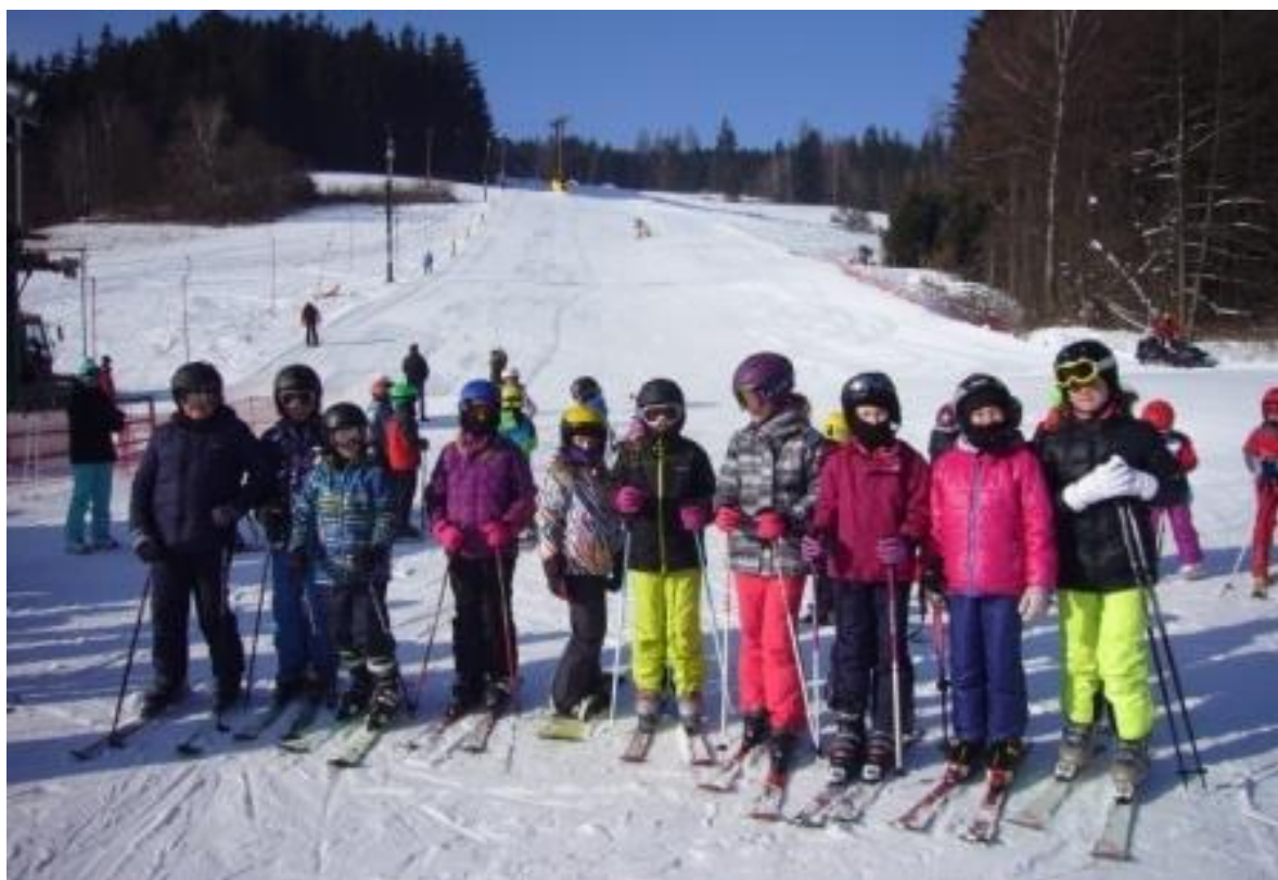
Lyžařský kurz v Hodoníně u Kunštátu