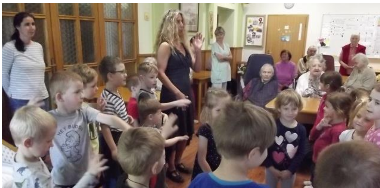
Vystoupení dětí v Domově Santina