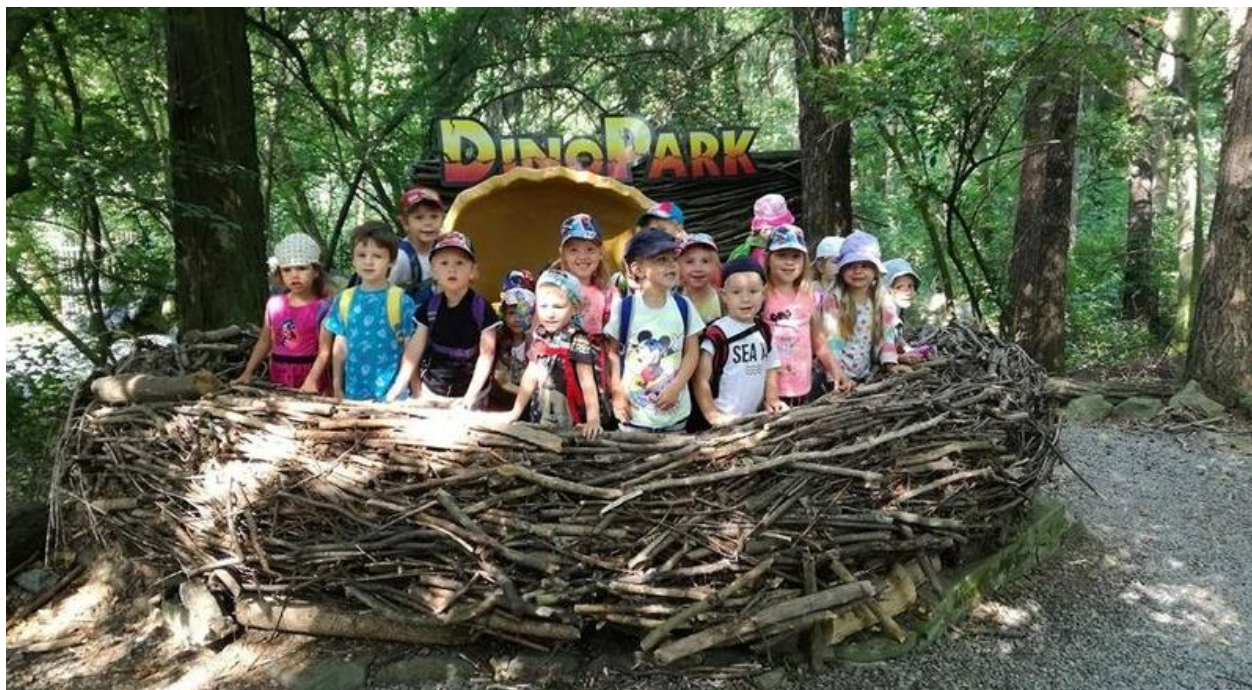
Výlet do Dinoparku