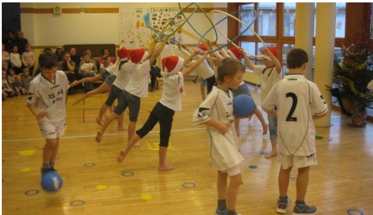
Den otevřených dveří školy