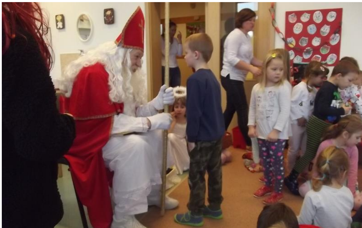
Návštěva Mikuláše s nadílkou

3. 12. 2017 – Návštěva Mikuláše, čerta a anděla spojená s nadílkou