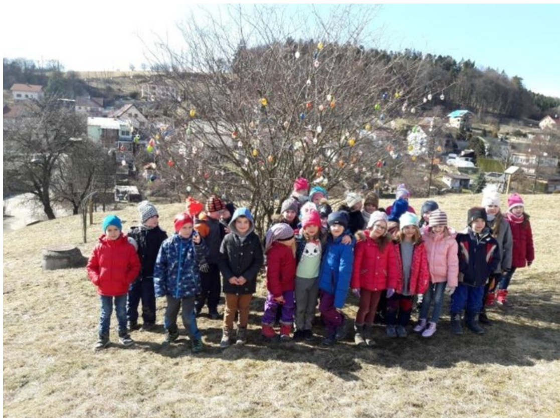
Výsledek velikonočního tvoření – Keř „Vajíčkovník“

Hledání velikonočního pokladu – 27. 3. 2018