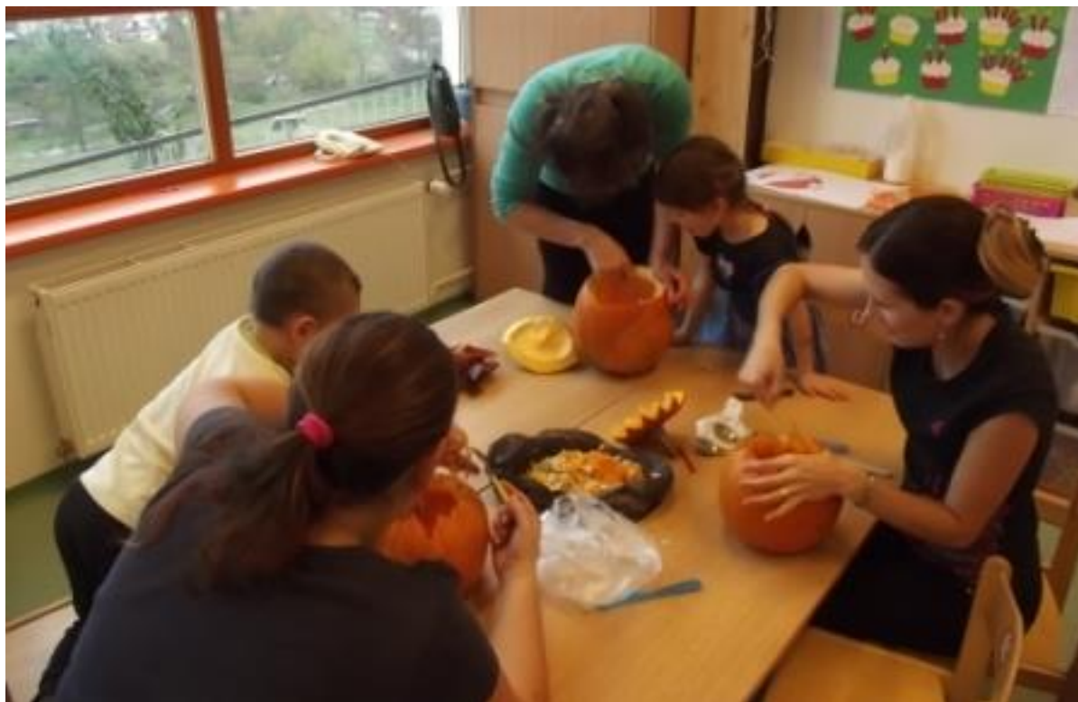
Tvoření s rodiči - Dýňování

25. 10. 2017 – Dýňování – společné tvoření s rodiči