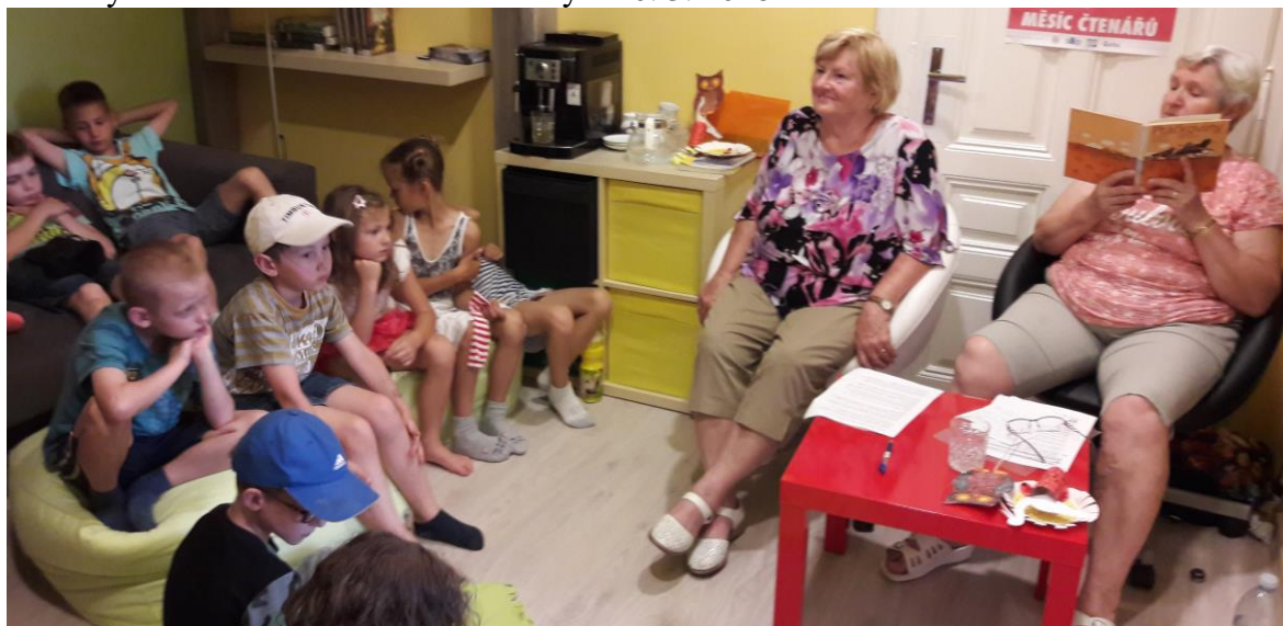
Babičky čtou dětem

Babičky čtou dětem - návštěva knihovny – 20. 3. 2018