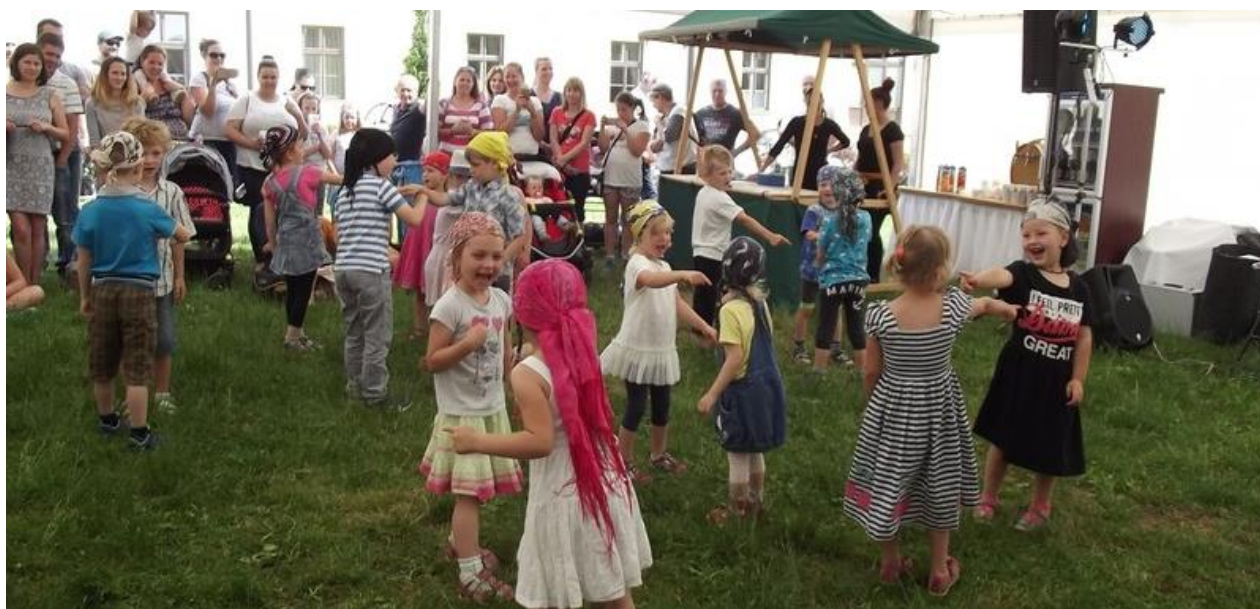
Den rodiny 2018